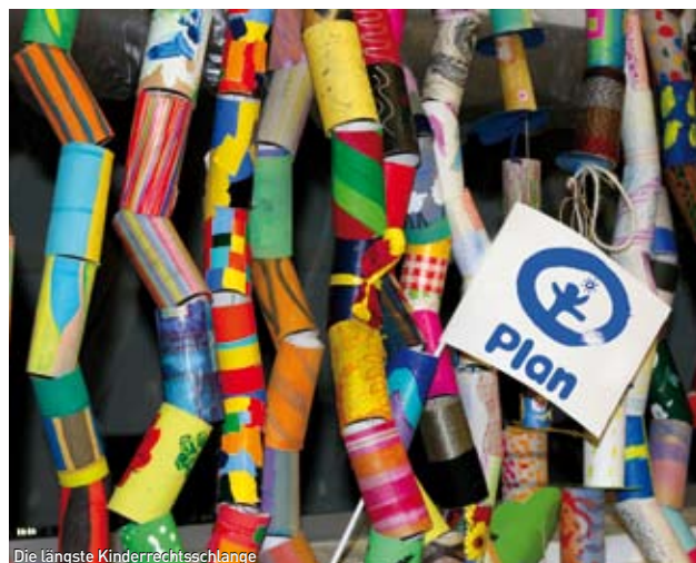
Die längste Kinderrechtsschlange

Auf dem Fest könnt Ihr Euch spielend über Eure Rechte informieren. Besonders toll wird die längste Kinderrechtsschlange der Welt , die von Kindern bei Plan International in ganz Deutschland begonnen wurde und die Ihr mit noch mehr bemalten Papprollen verlängern könnt! Wie viele Kilometer es wohl werden?