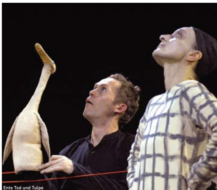
Ente Tod und Tulpe