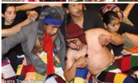
Teatro Trono, Bolivien