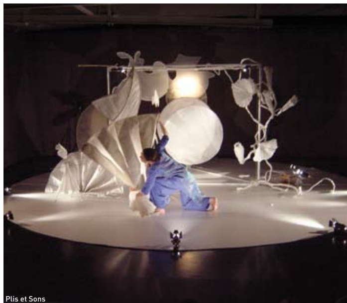
Plis et Sons