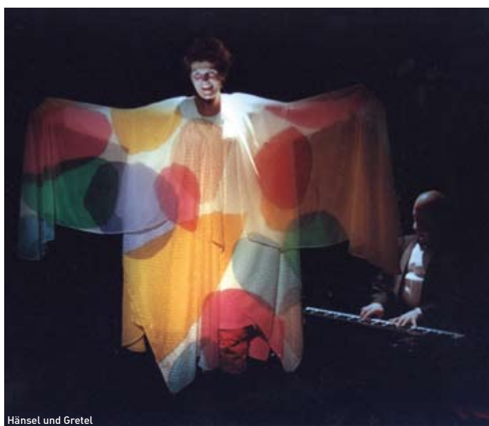
Hänsel und Gretel

Spiel: Bodil Alling + Søren Søndberg; Regie: Hans Rønne; Musik: Søren Søndberg; Bühnenbild: Gitte Baastrup