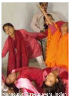
Mangolpuri Streetlayers, Indien