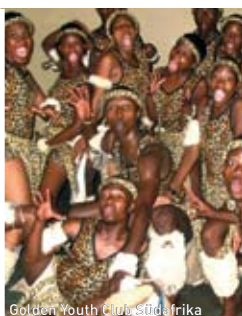
Golden Youth Club, Südafrika