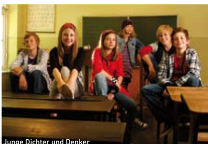
Junge Dichter und Denker