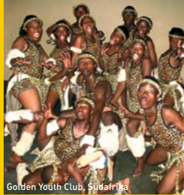
Golden Youth Club, Südafrika