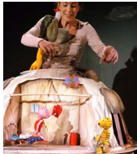
Guten Tag, kleines Schweinchen

Spiel: Anna Fülle; Regie: Christian Georg Fuchs; Bühne + Puppen: Kristine Stahl