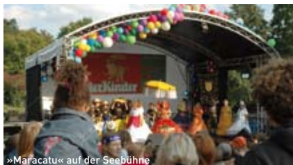
»Maracatu« auf der Seebühne Jochen, der Elefant