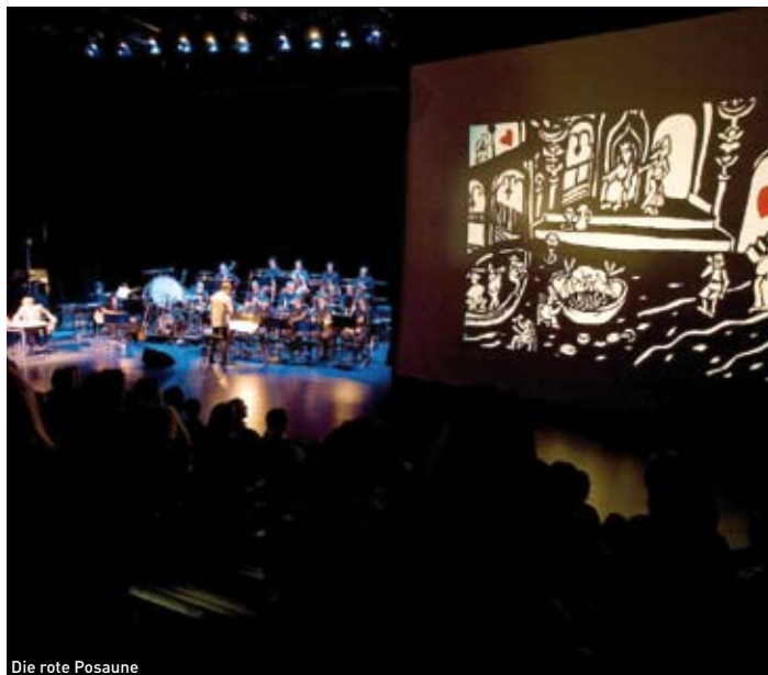
Die rote Posaune