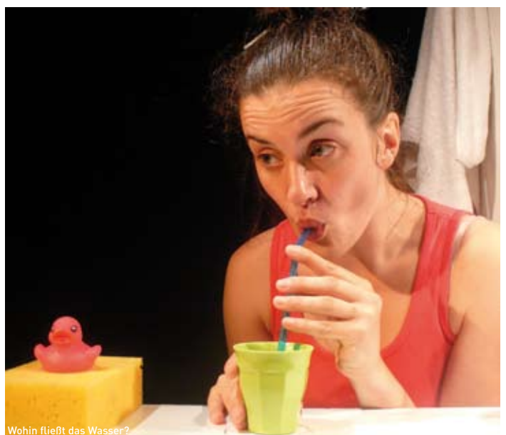
Wohin fließt das Wasser?

Spiel: Marie Blondel; Regie: Alban Coulaud; Bühnenbild: Isabelle Decoux; Text: Jeanne Ashbé