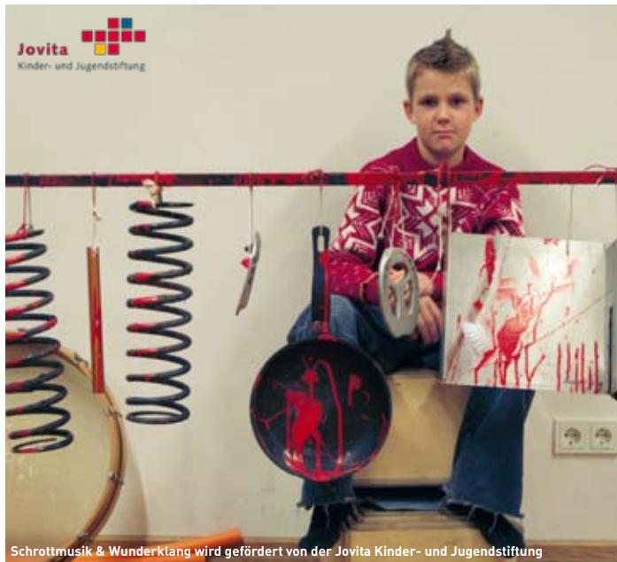
Schrottmusik & Wunderklang wird gefördert von der Jovita Kinder- und Jugendstiftung