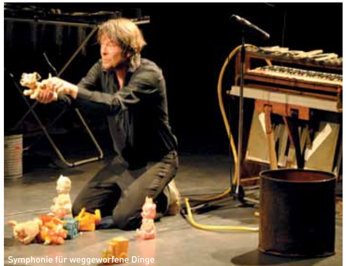
Symphonie für weggeworfene Dinge