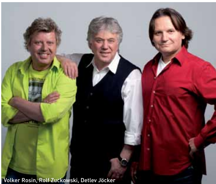
Volker Rosin, Rolf Zuckowski, Detlev Jöcker