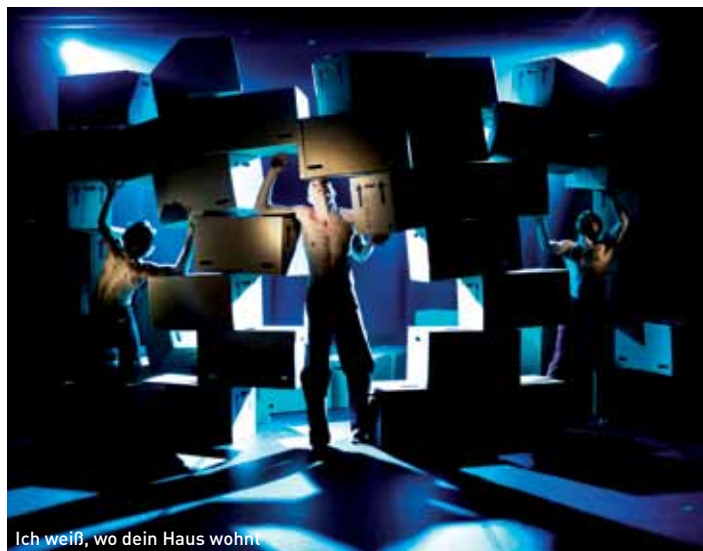
Ich weiß, wo dein Haus wohnt