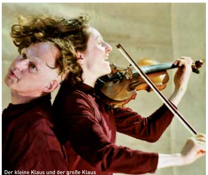
Der kleine Klaus und der große Klaus

Bühnenbild: Poul Fly Plejdrup; Musik: Anette Gøl + Uta Motz