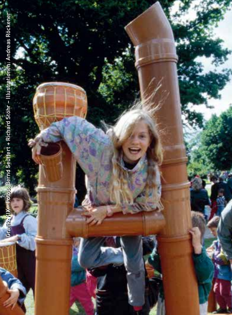
Grafik: MIX – Fotos: Bernd Seuffert + Richard Stöhr – Illustrationen: Andreas Röckner