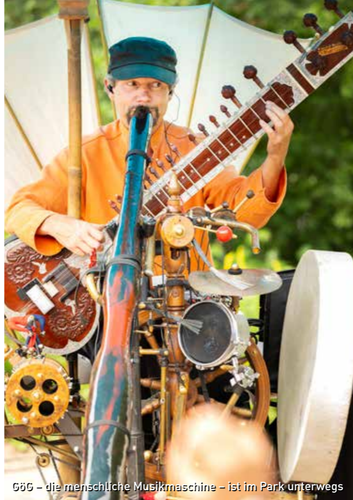
GÖG – die menschliche Musikmaschine – ist im Park unterwegs