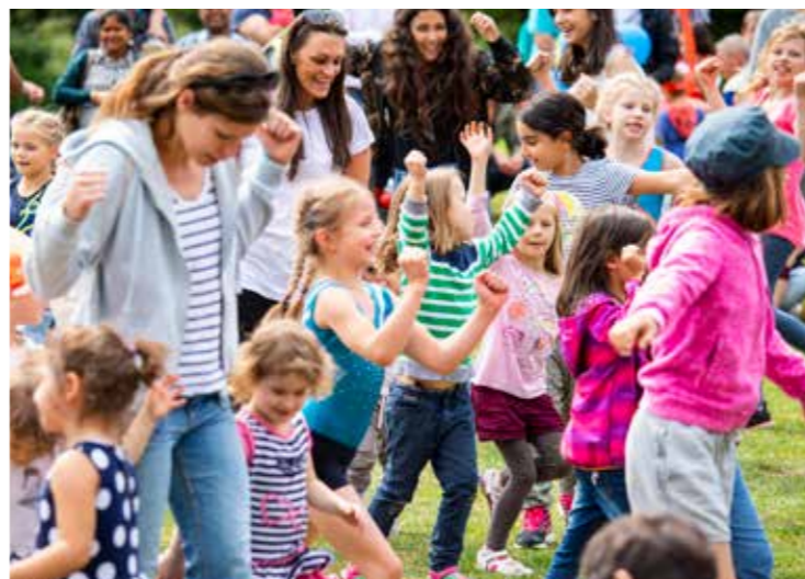
Kindertanzen mit dem Verband für Turnen u. Freizeit und sportspaß e.V.

Der Eintritt und alle Angebote sind frei!