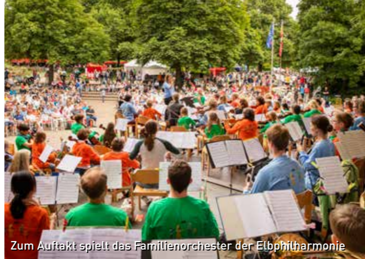
Zum Auftakt spielt das Familienorchester der Elbphilharmonie